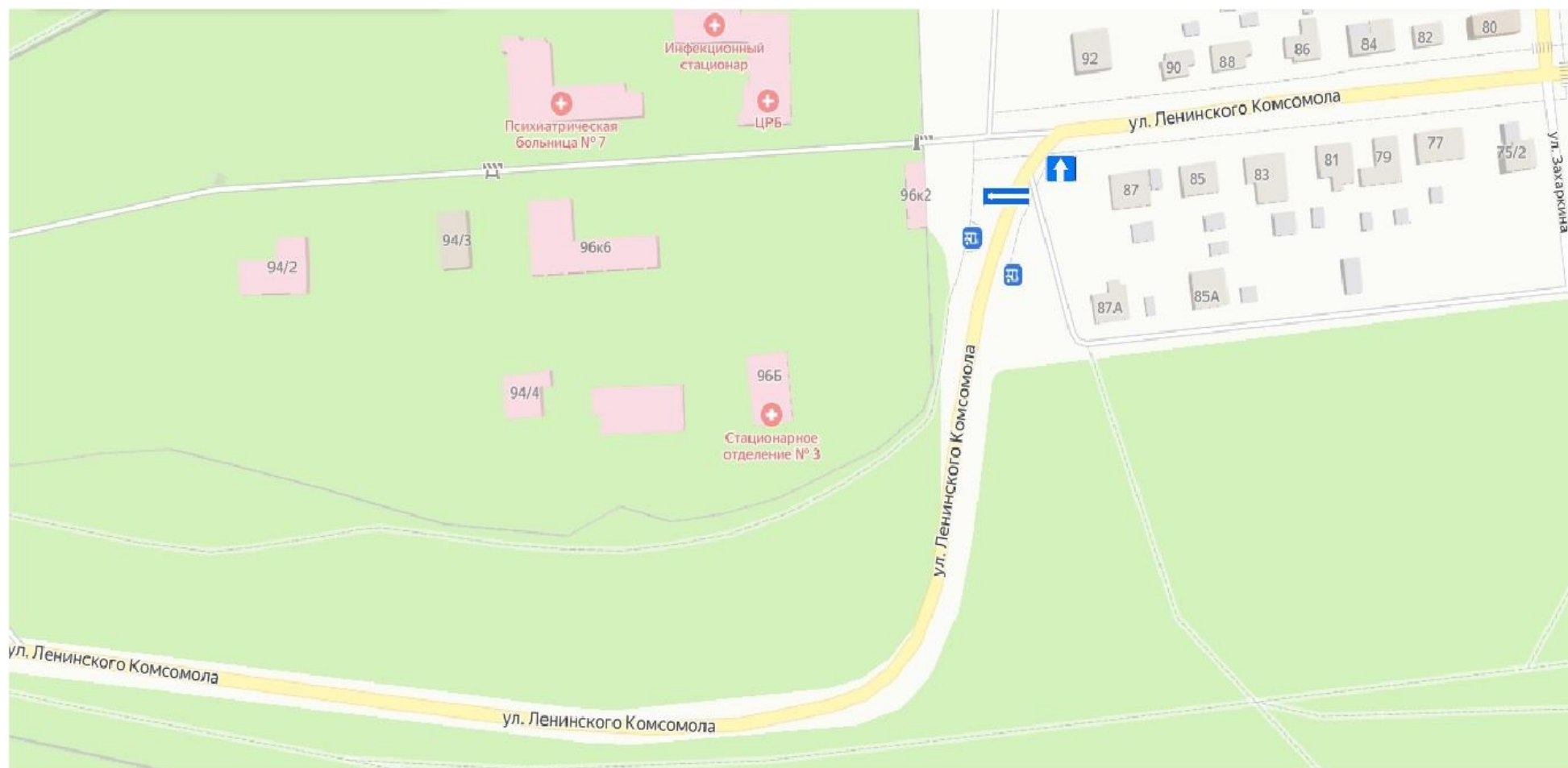
Схема установки временных дорожных знаков на территории Городского округа Серпухов Московской области 18 мая 2024 года с 08:00 до 16:00 часов