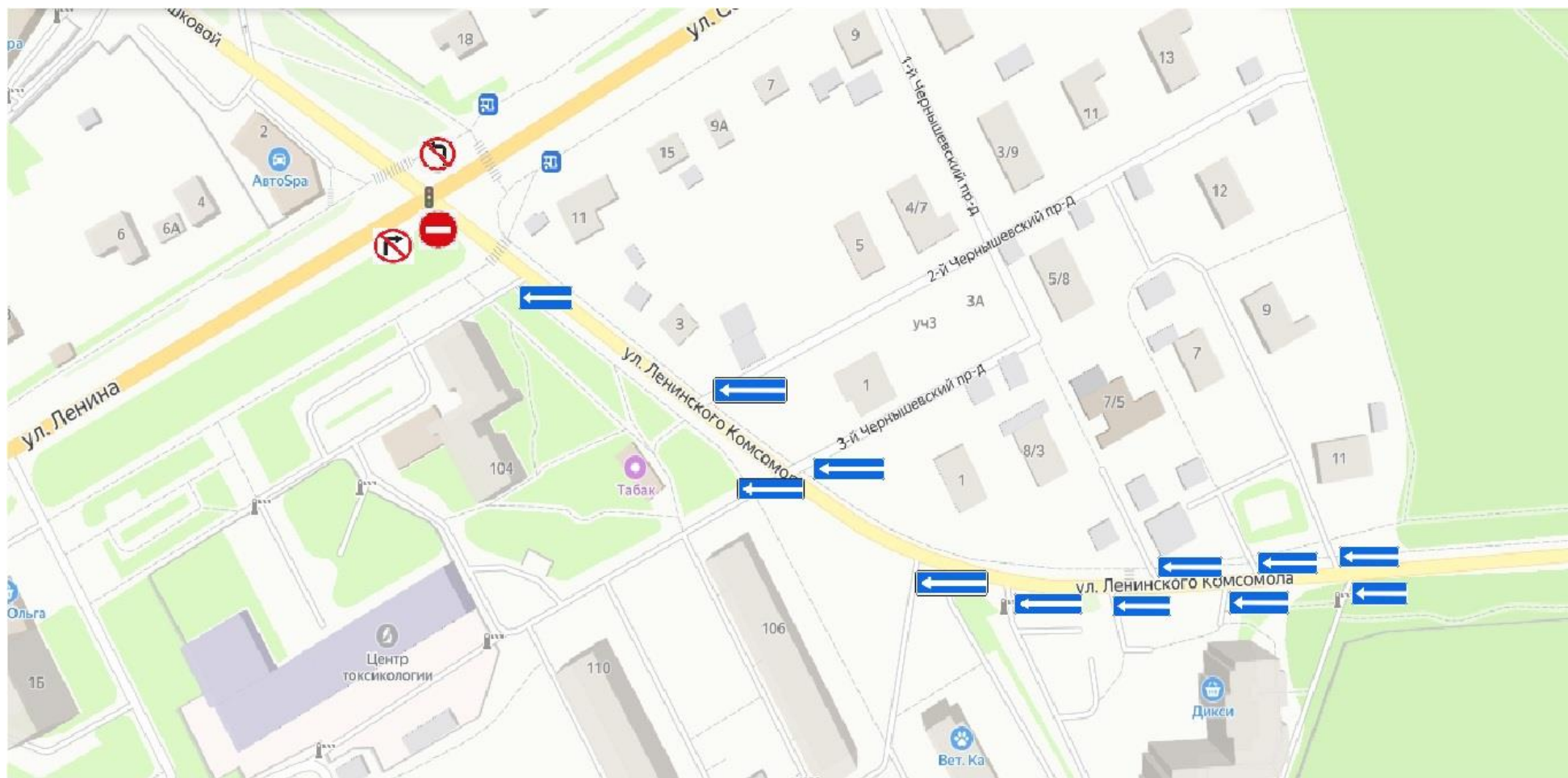
Схема установки временных дорожных знаков на территории Городского округа Серпухов Московской области 18 мая 2024 года с 08:00 до 16:00 часов